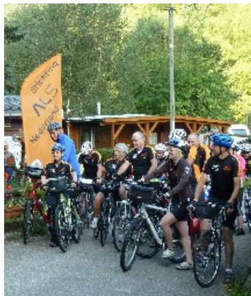
...klaar voor de start, ALS van A tot Z, Moosch (Fr), 2012

De start in Vlissingen zal feestelijk zijn, hopelijk onder grote belangstelling. Hoewel nog niet alles helemaal rond is, krijgen we samen met de zwemmers van Zwemmen langs Walcheren het startsein van de nieuwe burgemeester van Vlissingen van den Tillaar. De zwemmers zullen een trainingstocht zwemmen, de fietsers gaan richting pont. Plaats van actie is de Vlissingse Boulevard ter hoogte van het Badstrand; tussen